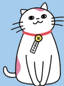
日本行政書士会連合会公式キャラクターウキヤマくん